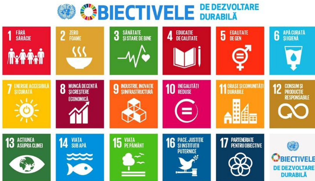
FIGURĂ 1 - OBIECTIVELE DE DEZVOLTARE DURABILĂ