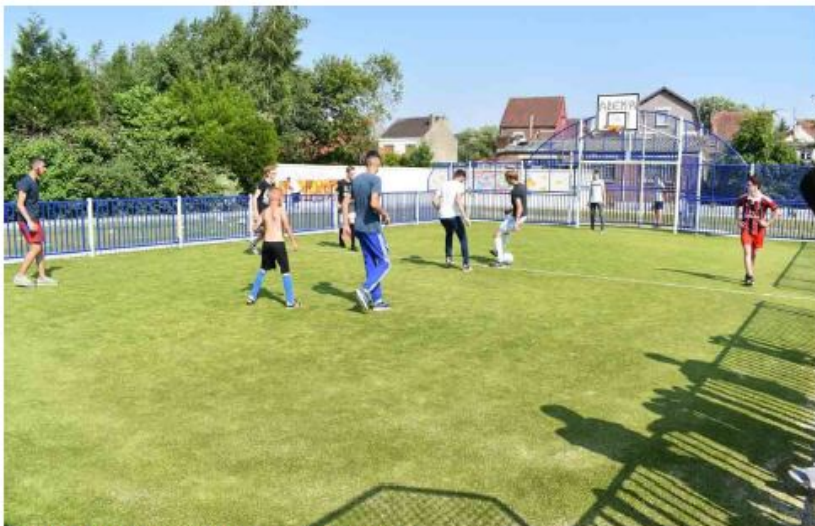
Bethune (Franța) - Parc Cheminots