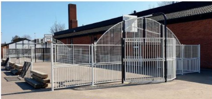
Furesø (Danemarca) - soluție ARENA