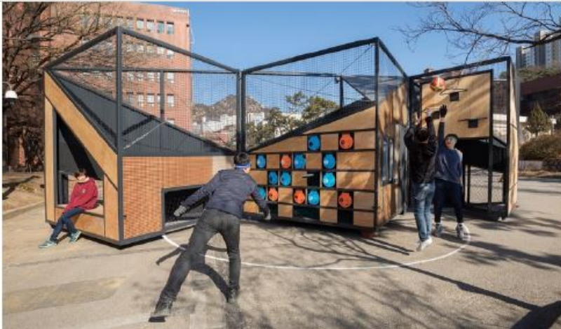
Seoul (Undefined Playground, B.U.S. Architecture)